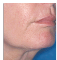
3 SEMANAS TRAS EL TERCER TRATAMIENTO