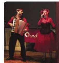
LA FIESTA Y EL ESPECTÁCULO PUSIERON BROCHE DE ORO A LA REUNIÓN