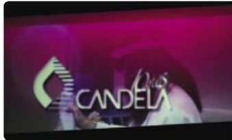
UN VIDEO CORPORATIVO RECORDÓ LOS PRINCIPALES ÉXITOS Y PROYECTOS DE FUTURO DE LA COMPAÑÍA